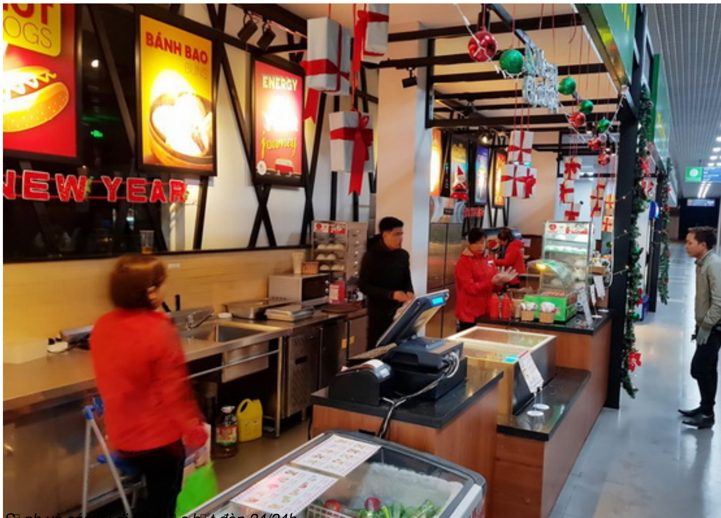
Số nh và các địa chỉ ra c b t đèn 24/24h.