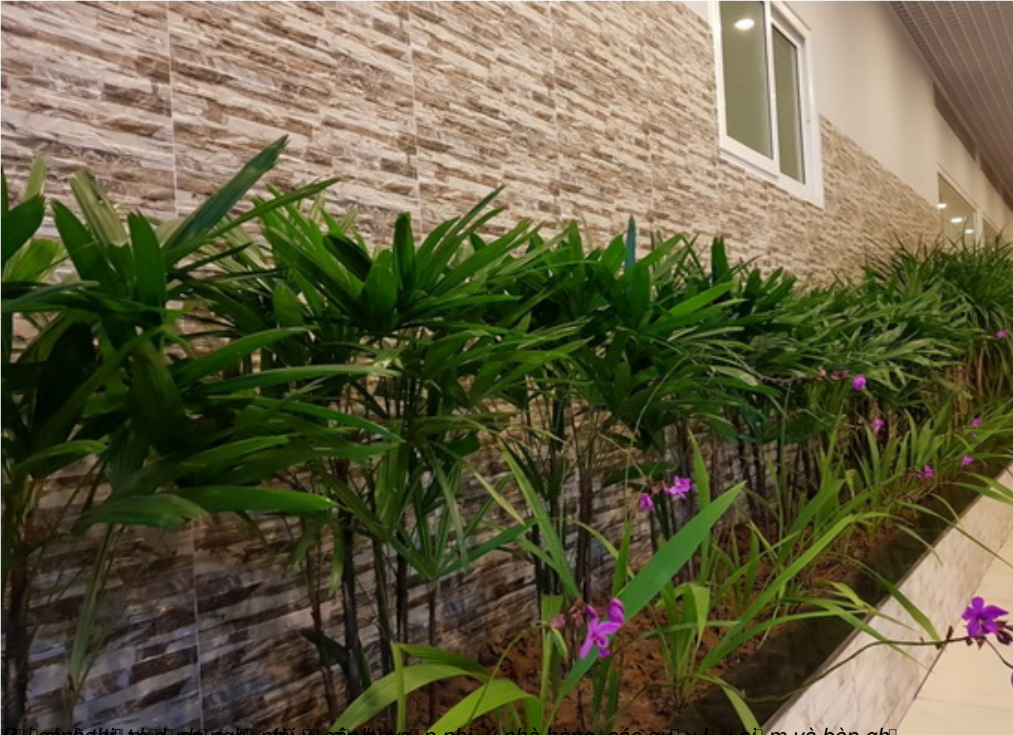
... các nhà thiết kế, người nghệ sĩ và các nhà sản xuất, các quy trình kỹ thuật và bàn ghế ...