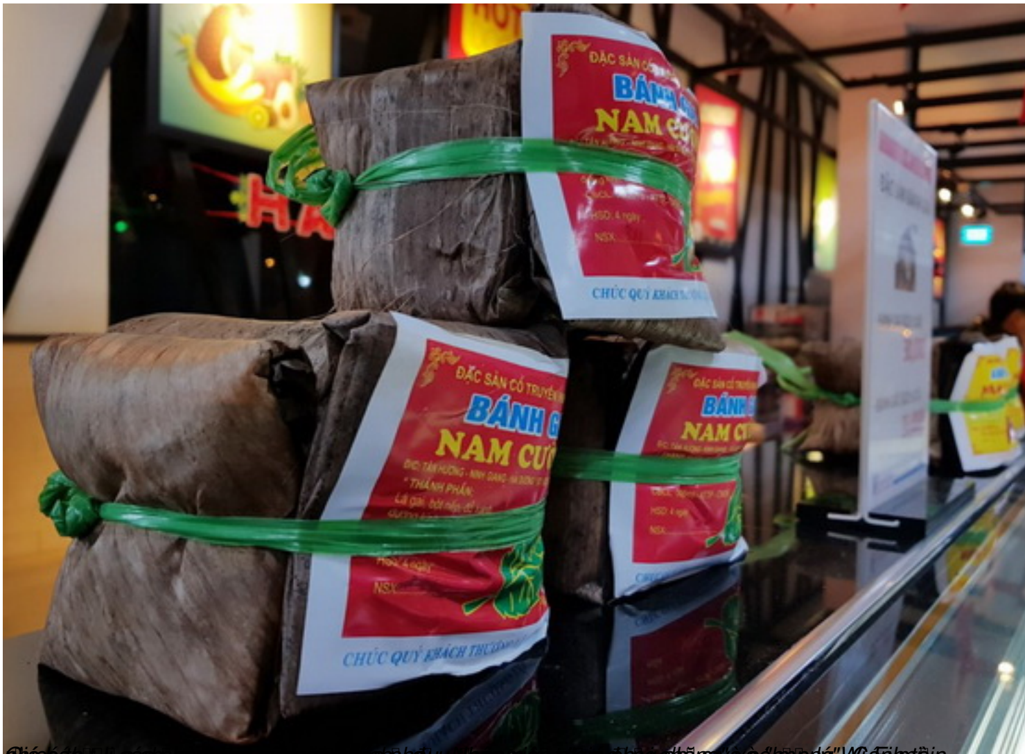
Đĩa bánh gai các thương hiệu cùng nhau và các nhà sản xuất gia đình phở và "hộp" Wafle trên