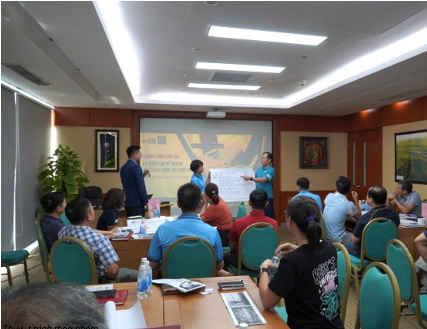
Thuyết trình theo nhóm