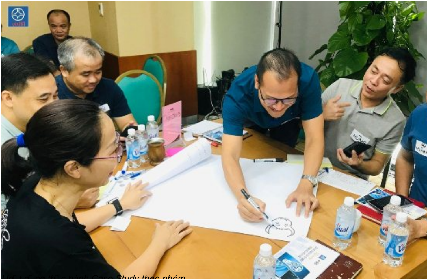
Hoạt động thực hành Case Study theo nhóm