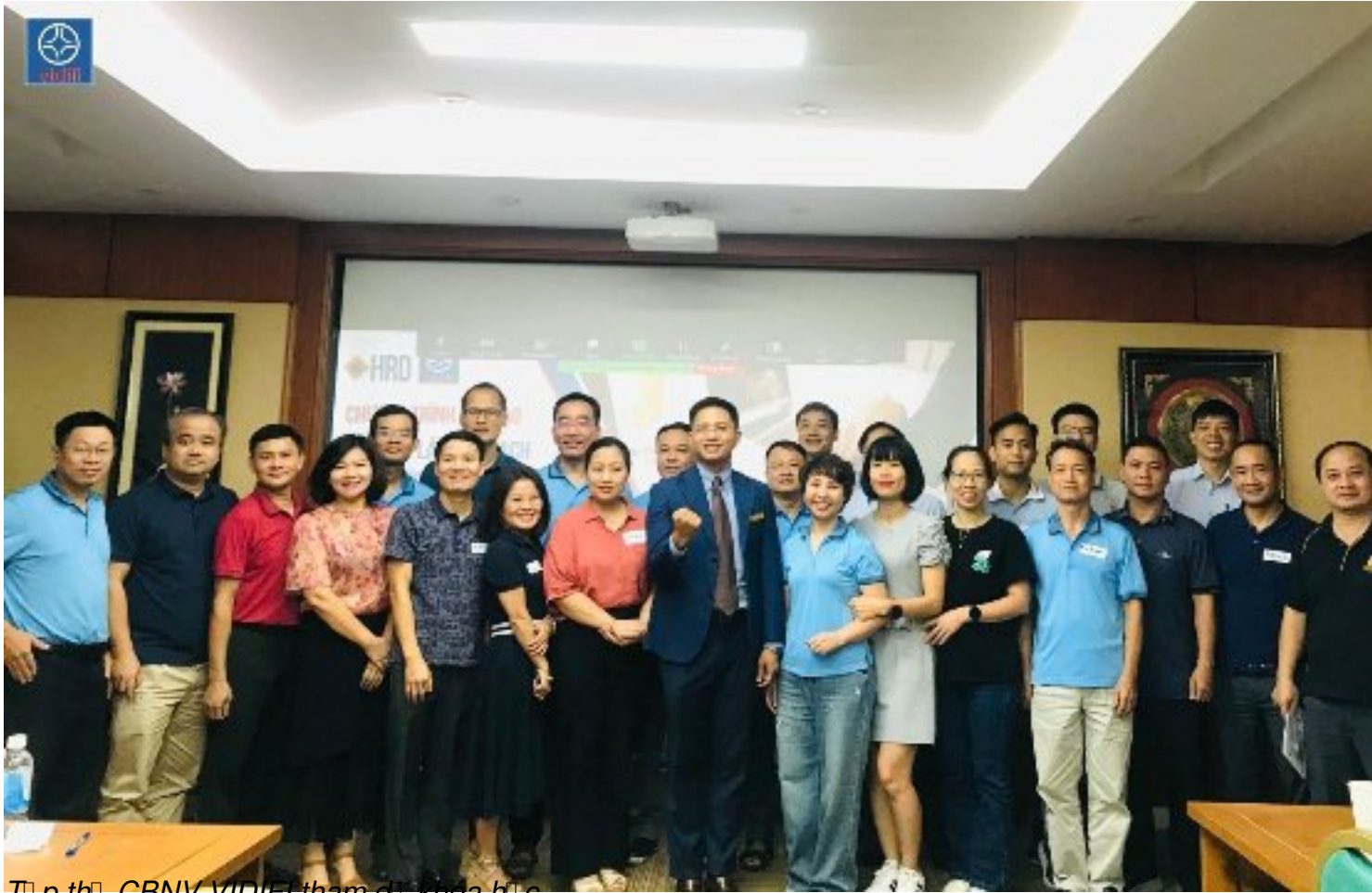
Thành viên CBNV VIDIFI tham dự khóa học