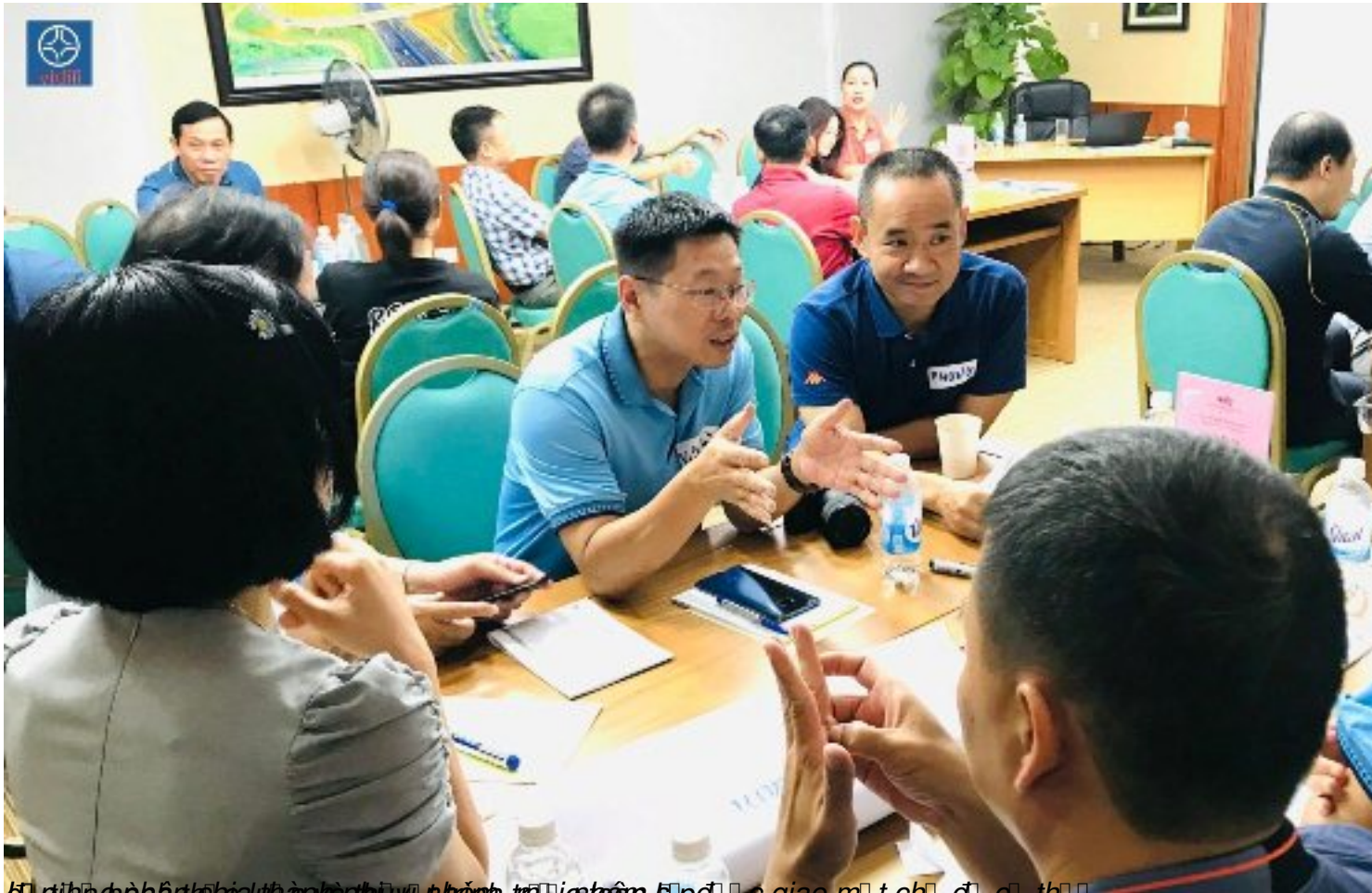
Biên phòng và các đơn vị liên quan tham gia buổi giao lưu, trao đổi và chia sẻ kinh nghiệm.