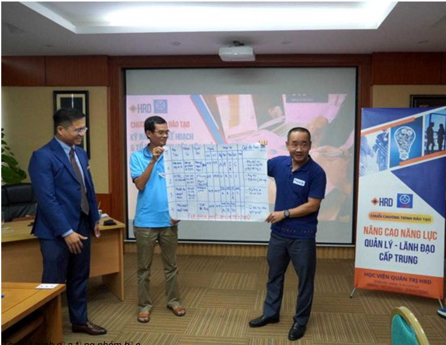
Thầy trình bày và tổng hợp nhóm học