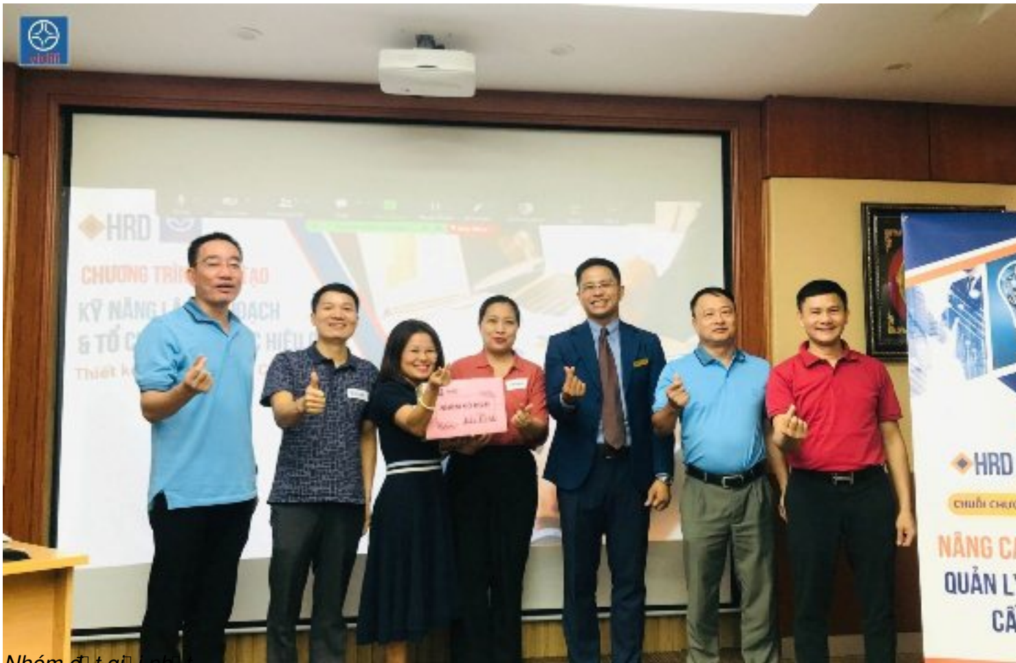
Nhóm đã tốt nghiệp