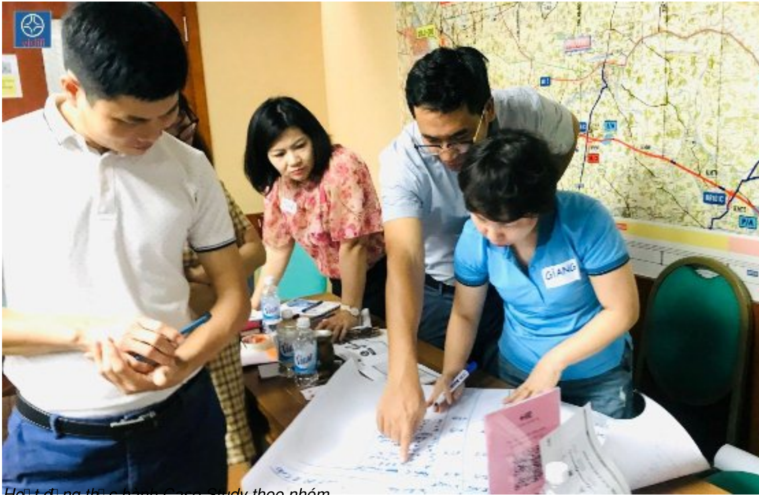
Hoạt động thực hành Case Study theo nhóm